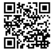
【大会ホームページ】