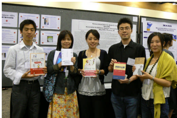
(写真1) 本のプレゼント

米の日本人学生が、ポツリポツリと現れるようになったのである。彼らの中には、日本で行動分析学の研究や実践が行われていることを、ポスターを見るまでは知らなかった者さえいた。そして、いつしか、J-ABA のポスターを前にして、それらの在米学生と日本から参加した学生とが貴重な情報交換をするようになったのである。前者は、帰国後の就労のため、後者は米国の大学院や企業の情報を集めるために。