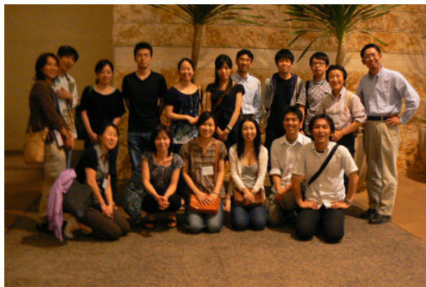
(写真2) ホテルの前で全員集合!

せっかく出会った若き行動分析家たちの情報交換の機会をさらに増やすために、何かもつとできることはないか？ 私は実は 1993 年以来上面発酵麦酒の研究と実践(飲むこと)を趣味にしており、ABAI で訪米の折には、何人かの親しい学生たちと当地のマイクロブリュワリー(地ビール醸造所併設パブ)を最低一カ所訪れ